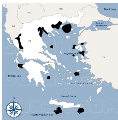
Karte griechischer Ölfelder

Bis heute ist die Ölförderung in Griechenland jedoch nur sehr gering. 2003 wurden ca. 6.400 bl/Tag, hauptsächlich in den Epsilon Feldern des Prinos Beckens und dem Kallirachi Feld nahe der Insel Thassos in der nördlichen Ägäis gefördert! Das amerikanisch-kanadisch-griechische Öl-Konsortium „North Aegean Petroleum Company“ (NAPC) betreibt das Prinos Feld seit 1996. Seit Feb. 2001, als das Fördervolumen stark sank, übernahm die grösste Refinerie des Landes, die „Kavala Oil“ und verkaufte es danach an die staatliche „Hellenic Petroleum“ (HP).